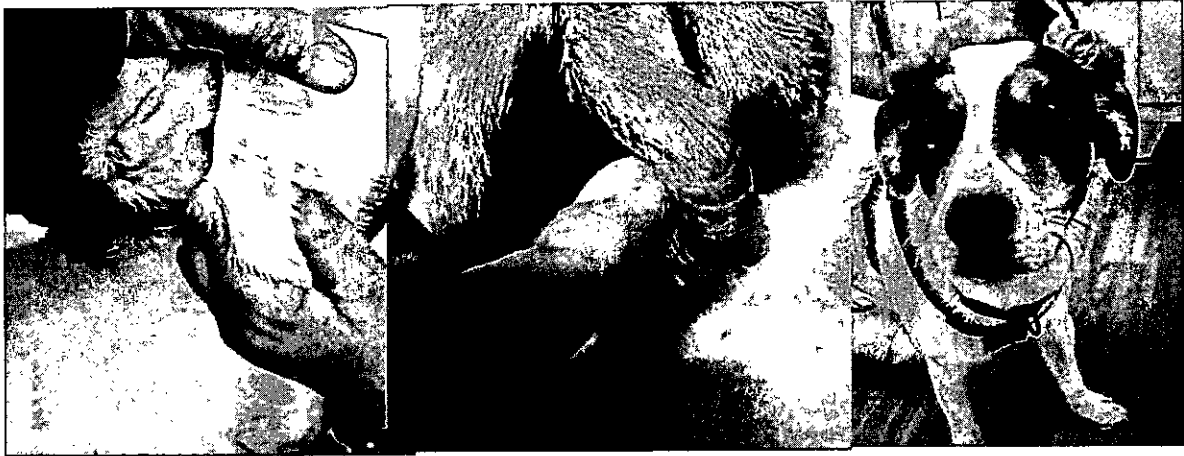
Paciente alérgico alimentario en consulta. Se inicia tratamiento con cambio de alimentación.